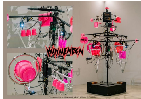
《Wanmenben》2022 年、 FSKM - Festival Komunitas Seni Media 2022、 インドネシア