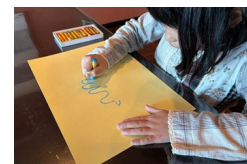
子どもプログラム

ワークショップ等を通じて自然の中で子どもたちが現代アートに触れられる機会を増やし、次世代の文化芸術の担い手や支え手を育てていきます。