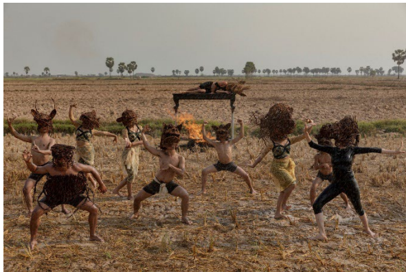
クウワイ・サムナン《Calling for Rain》2021年 ©Khvay Samnang