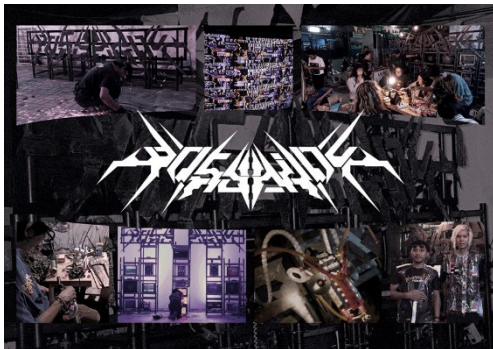
《Posyahdu》2023 年、 Pekan Kebudayaan Nasional 2023、インドネシア