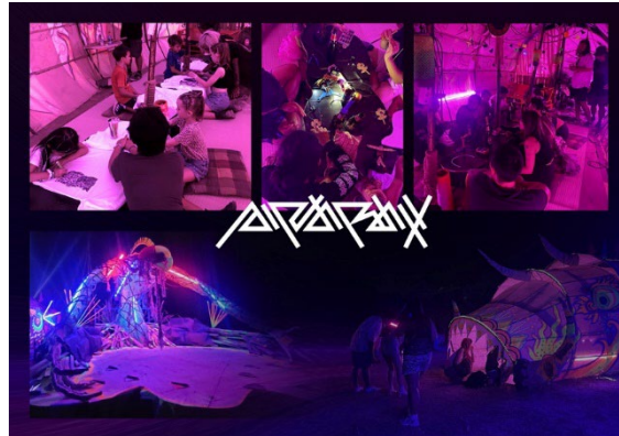
Waft Lab《Pinarak》2023年 Wonderfruit Festival 2023、タイ